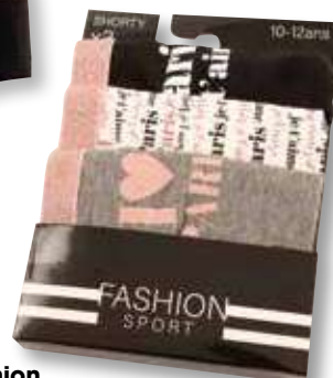
Ref. 968 Shorty Fashion

Composition : 100% coton 2 tailles : T1 (10/12 ans) - T2 (14/16 ans)