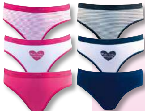
Ref. 681 Slip Pockets coton DIM

Composition : 95% coton - 5% élasthanne 4 tailles : T2 (10 ans) - T3 (12 ans) T4 (14 ans) - T5 (16 ans)