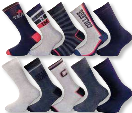
Ref. 944 Chaussettes College

Composition : 73% polyester - 24% coton - 3% élasthanne 3 tailles : T1 (27/30) - T2 (31/34) - T3 (35/38)