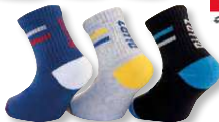
Ref. 947 Chaussettes tige 3/4 Lotto

Composition : 59% coton - 36% polyester - 4% élastodienne - 1% élasthanne 3 tailles : T1 (27/30) - T2 (31/35) - T3 (36/39)