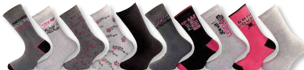
Ref. 941 Chaussettes Play

Composition : 59% polyester - 27% coton - 12% viscose 2% élasthanne - 3 tailles : T1 (27/30) - T2 (31/34) - T3 (35/38)