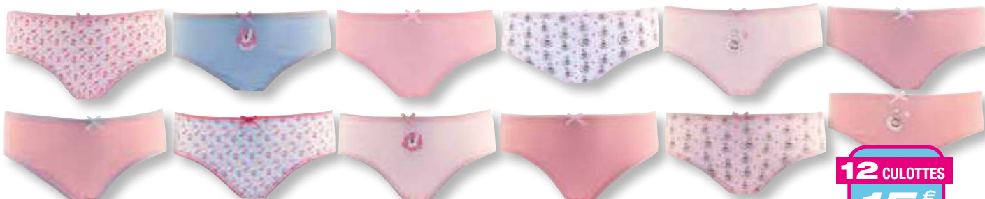
Ref. 600 Culotte Funny Girl Composition : 63% polyester - 32% coton - 5% élasthanne - 3 tailles : T1 (2/3 ans) - T2 (4/5 ans) - T3 (6/8 ans)

Composition : 95% coton - 5% élasthanne 4 tailles : T1 (3 mois) - T2 (6 mois) - T3 (12 mois) - T4 (18 mois)