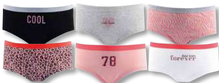
Ref. 967 Shorty Fashion Composition : 100% coton - 2 tailles : T1 (10/12 ans) - T2 (14/16 ans)