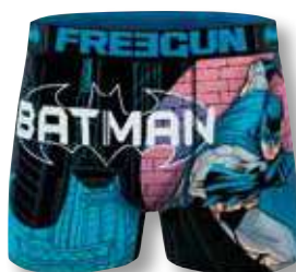
Ref. 917 Batman