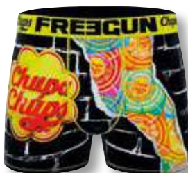
Ref. 916 Chupa Chups