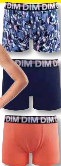
Ref. 684 Boxer ECO DIM mode

Composition : 95% coton - 5% élasthanne 4 tailles : T1 (8 ans) - T2 (10 ans) - T3 (12 ans) - T4 (14 ans)