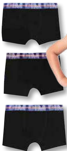
Ref. 683 Boxer ECO DIM classic