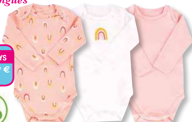
Ref. 675 Body col américain DIM

Composition : 95% coton - 5% élasthanne 4 tailles : T1 (3 mois) - T2 (6 mois) - T3 (12 mois) - T4 (18 mois)