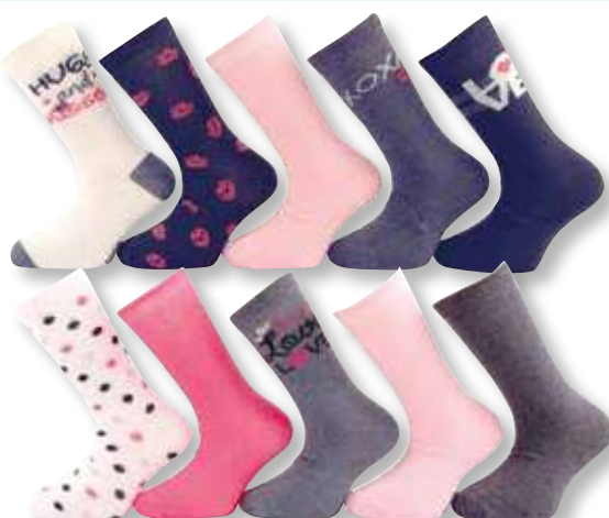
Ref. 940 Chaussettes Love

Composition : 73% polyester - 23% coton - 2% élasthanne - 2% viscose 3 tailles : T1 (27/30) - T2 (31/34) - T3 (35/38)