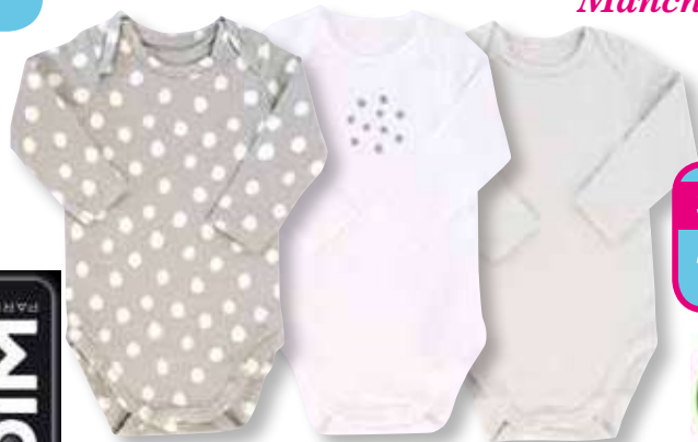
Ref. 674 Body col américain DIM

Composition : 95% coton - 5% élasthanne 3 tailles : T1 (3 mois) - T3 (12 mois) - T4 (18 mois)