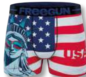
Ref. 914 America