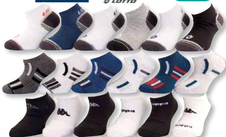
Ref. 905 Chaussettes tige courte Kappa, Lotto, Sergio Tacchini

Composition : 57% coton - 41% polyester - 2% élasthanne - 3 tailles : T1 (27/30) - T2 (31/35) - T3 (36/39)