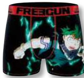
Ref. 931 My Hero Academia