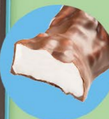
Un cœur tendre en guimauve enrobé de chocolat au lait

LA BOITE DE 28 LAPINS EN GUIMAUVE ENROBÉS DE CHOCOLAT AU LAIT** - 280 G NET