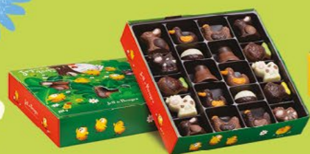
LE BALLOTIN DE 250 G NET 20 CHOCOLATS ASSORTIS