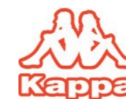
Ref. 433 Chaussettes tige 3/4 Kappa Composition : 53% coton - 41% polyester - 5% élastodienne - 1% élasthanne Taille unique : 36/41

AVEC BANDE DE RESSERRAGE POUR UN MEILLEUR MAINTIEN ET CONFORT.