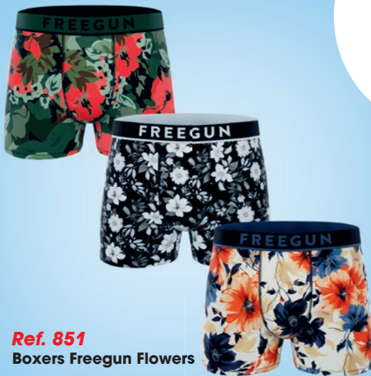
Ref. 851 Boxers Freegun Flowers