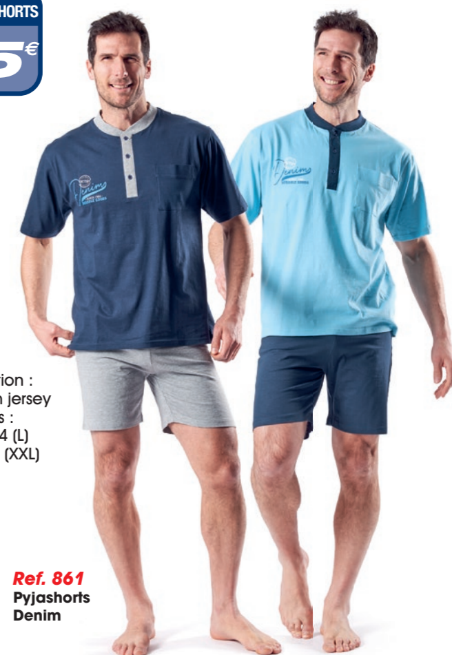
Ref. 861 Pyjashorts Denim

Composition : 100% coton jersey 4 tailles : T3 (M) - T4 (L) T5 (XL) - T6 (XXL)