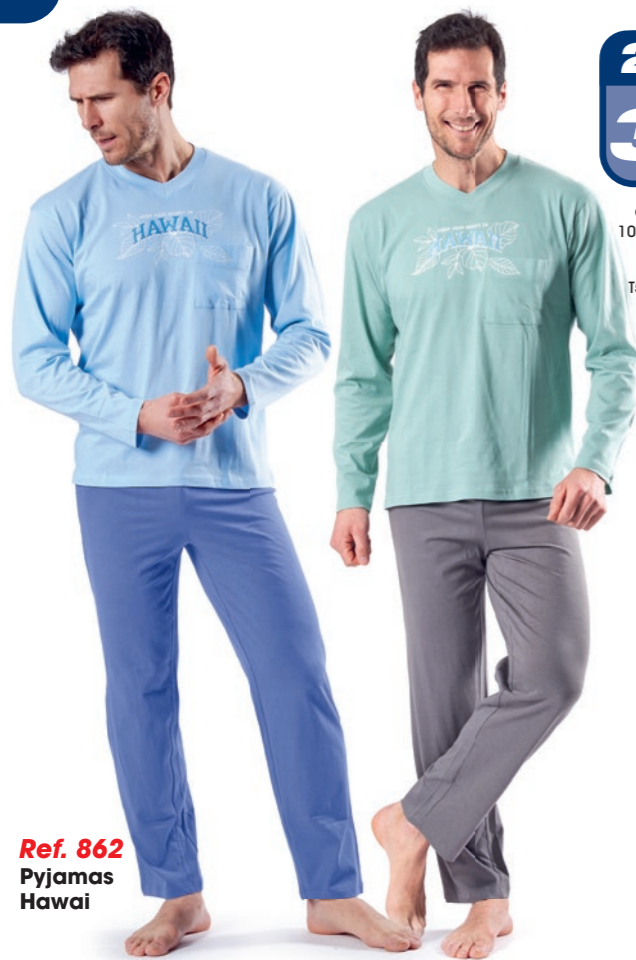
Ref. 862 Pyjamas Hawaii