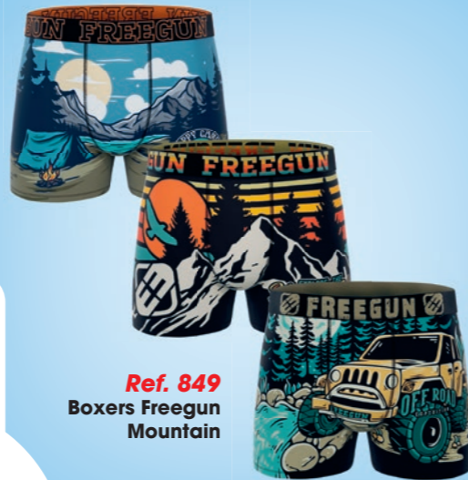
Ref. 849 Boxers Freegun Mountain