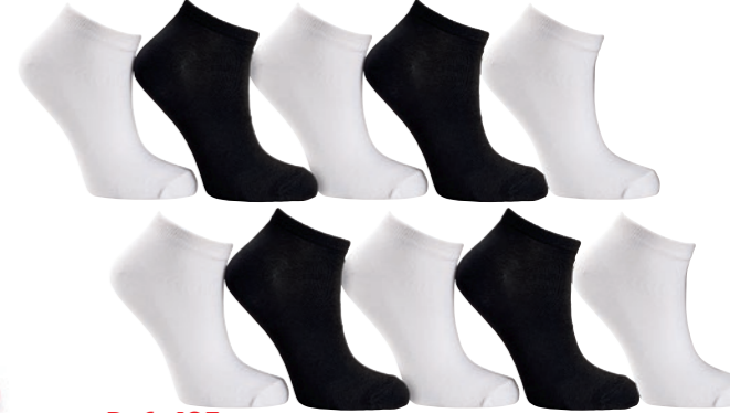
Ref. 405 Chaussettes tige courte unies Composition : 72% coton - 26% polyester - 2% élasthanne Taille unique : 36/41