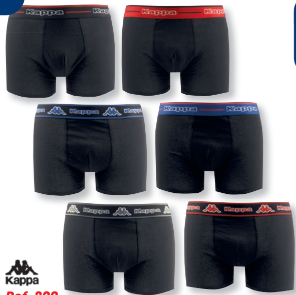
Ref. 800 Boxers Kappa