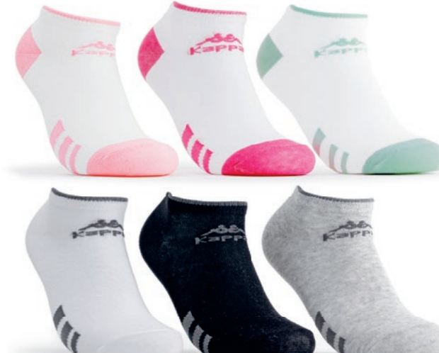
Ref. 493 Chaussettes tige courte Kappa Composition : 64% coton - 27% polyester - 8% polyamide - 1% élasthanne Taille unique : 36/41