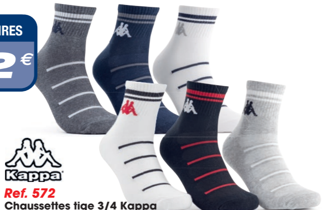
Ref. 572 Chaussettes tige 3/4 Kappa Composition : 67% coton - 31% polyester - 2% élasthanne 2 tailles : T1 (39/42) - T2 (43/46)