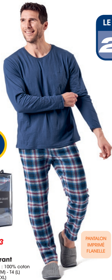
Ref. 853 Pyjama Oliver Grant Composition : 100% coton 4 tailles : T3 (M) - T4 (L) T5 (XL) - T6 (XXL)