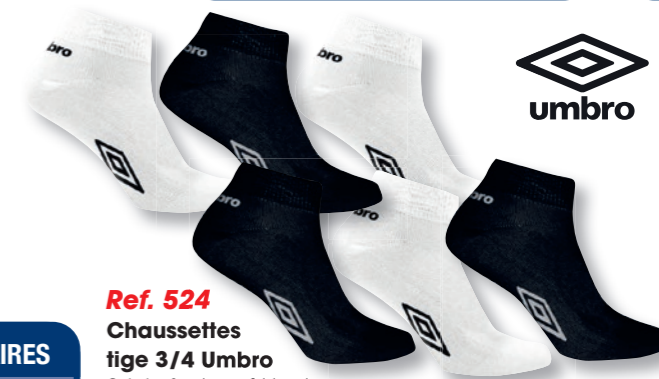
Ref. 524 Chaussettes tige 3/4 Umbro Coloris : 3 noires + 3 blanches Composition : 58% coton - 40% polyester - 2% élasthanne 2 tailles : T1 (39/42) - T2 (43/46)