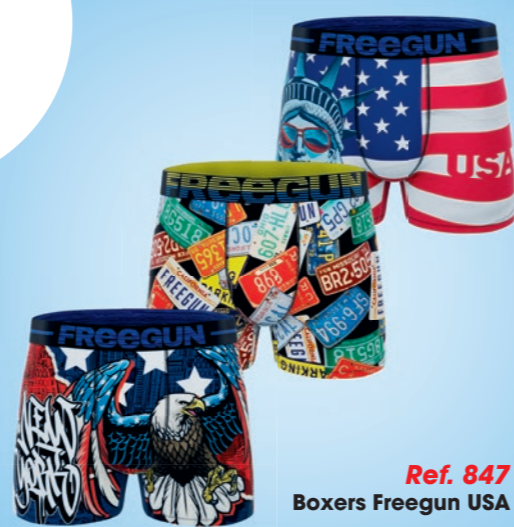
Ref. 847 Boxers Freegun USA