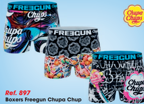
Ref. 897 Boxers Freegun Chupa Chup