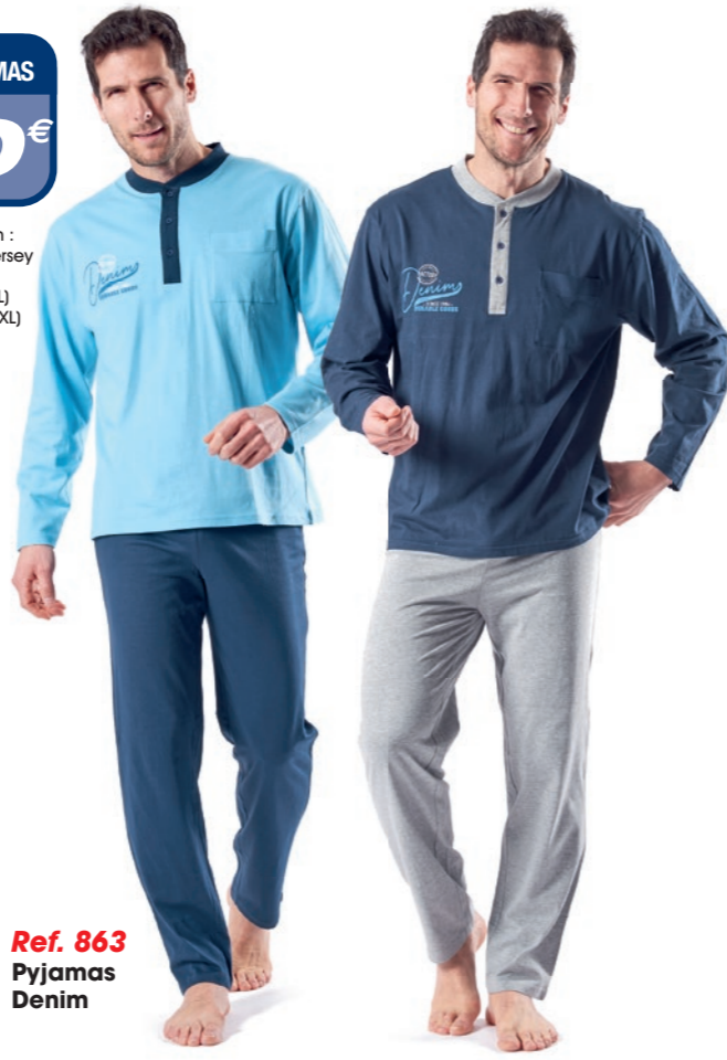
Ref. 863 Pyjamas Denim

Composition : 100% coton Jersey 4 tailles : T3 (M) - T4 (L) T5 (XL) - T6 (XXL)