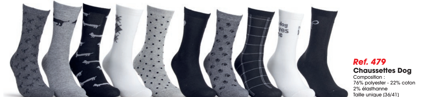
Ref. 479 Chaussettes Dog Composition : 76% polyester - 22% coton - 2% élasthanne Taille unique (36/41)