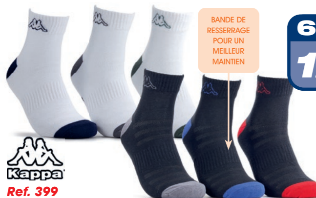
Ref. 399 Chaussettes tige 3/4 Kappa Composition : 64% coton - 32% polyester - 1% élasthanne - 3% élastodienne 2 tailles : T1 (39/42) - T2 (43/46)