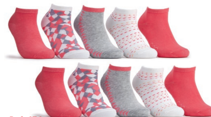
Ref. 474 Chaussettes tige courte Pink Composition : 75% coton - 23% polyamide - 2% élasthanne Taille unique (37/41)