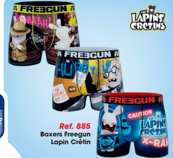
Ref. 885 Boxers Freegun Lapin Crétin