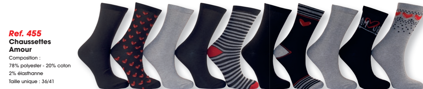
Ref. 455 Chaussettes Amour Composition : 78% polyester - 20% coton - 2% élasthanne Taille unique : 36/41