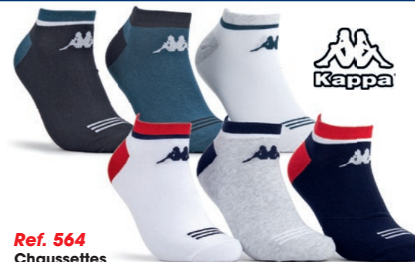
Ref. 564 Chaussettes tige courte Kappa Composition : 65% coton - 33% polyester - 2% élasthanne 2 tailles : T1 (39/42) - T2 (43/46)