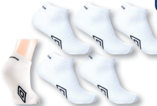
Ref. 544 Chaussettes tige courte Umbro Composition : 58% coton - 40% polyester - 2% élasthanne 2 tailles : T1 (39/42) - T2 (43/46)