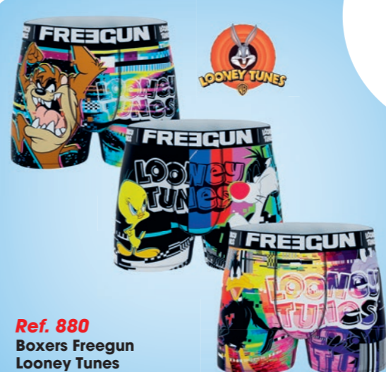
Ref. 880 Boxers Freegun Looney Tunes