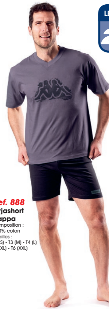
Ref. 888 Pyjashort Kappa Composition : 100% coton 5 tailles : T2 (S) - T3 (M) - T4 (L) T5 (XL) - T6 (XXL)