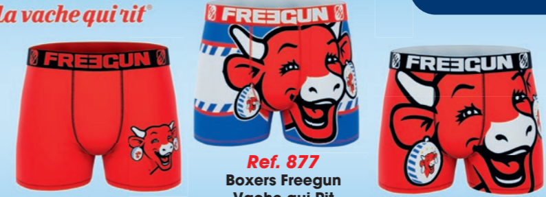
Ref. 877 Boxers Freegun Vache qui Rit