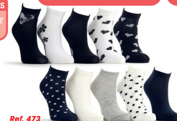
Ref. 473 Chaussettes tige courte Chic Composition : 73% coton - 25% polyester - 2% élasthanne Taille unique (37/41)