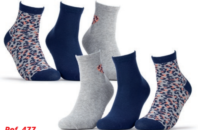
Ref. 477 Chaussettes tige 3/4 Léopard Composition : 69% coton - 26% polyester - 2% polyamide - 3% élasthanne Taille unique (37/41)