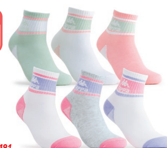
Ref. 491 Chaussettes tige 3/4 Kappa Composition : 56% coton - 35% polyester - 4% polyamide 4% élastodienne - 1% élasthanne. Taille unique : 36/41