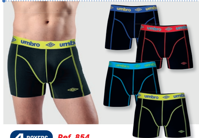
4 BOXERS 20€ Ref. 854 Boxers Umbro Composition : 95% coton - 5% élasthanne 4 tailles : T3 (M) - T4 (L) - T5 (XL) - T6 (XXL)