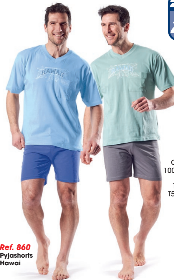
Ref. 860 Pyjashorts Hawaii