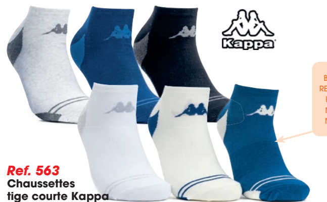
Ref. 563 Chaussettes tige courte Kappa Composition : 70% coton - 28% polyester - 2% élasthanne 2 tailles : T1 (39/42) - T2 (43/46)