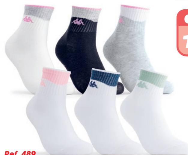
Ref. 489 Chaussettes tige 3/4 Kappa Composition : 57% coton - 34% polyester - 4% polyamide 4% élastodienne - 1% élasthanne Taille unique : 36/41