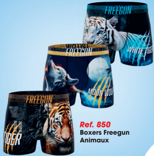
Ref. 850 Boxers Freegun Animaux