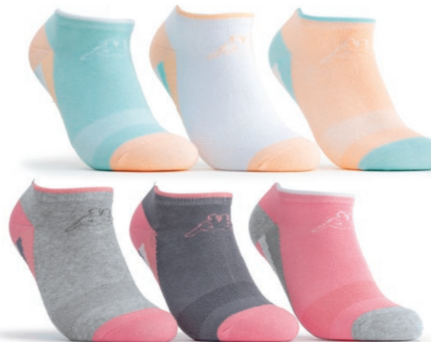
Ref. 492 Chaussettes tige courte Kappa Composition : 59% coton - 39% polyester - 2% élasthanne Taille unique : 36/41