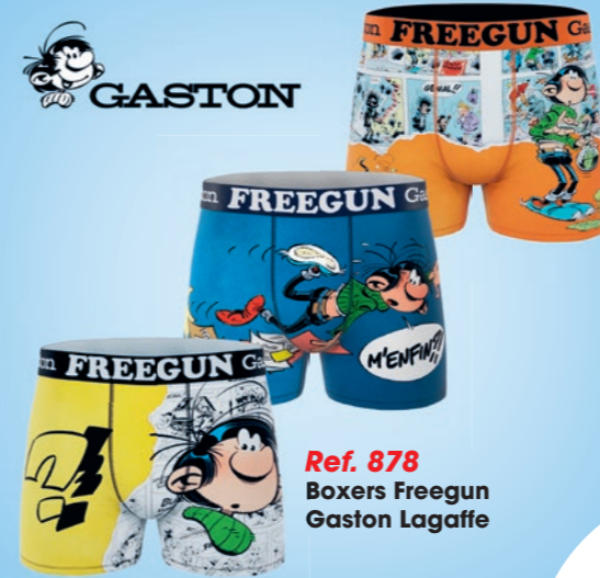
Ref. 878 Boxers Freegun Gaston Lagaffe