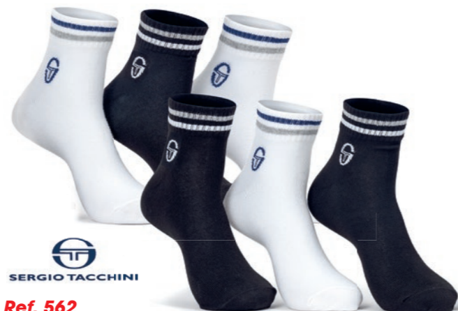
Ref. 562 Chaussettes tige 3/4 Sergio Tacchini Composition : 98% polyester - 2% élasthanne 2 tailles : T1 (39/42) - T2 (43/46)