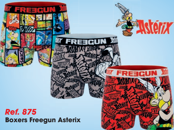
Ref. 875 Boxers Freegun Asterix