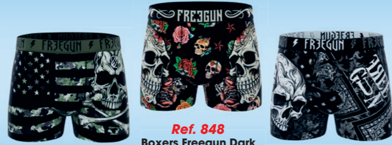
Ref. 848 Boxers Freegun Dark