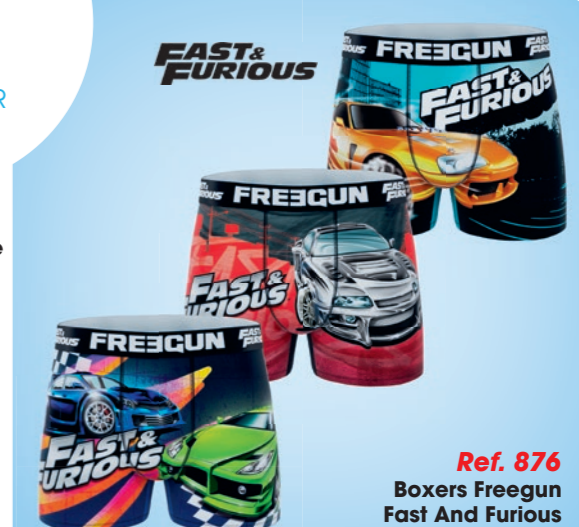
Ref. 876 Boxers Freegun Fast And Furious