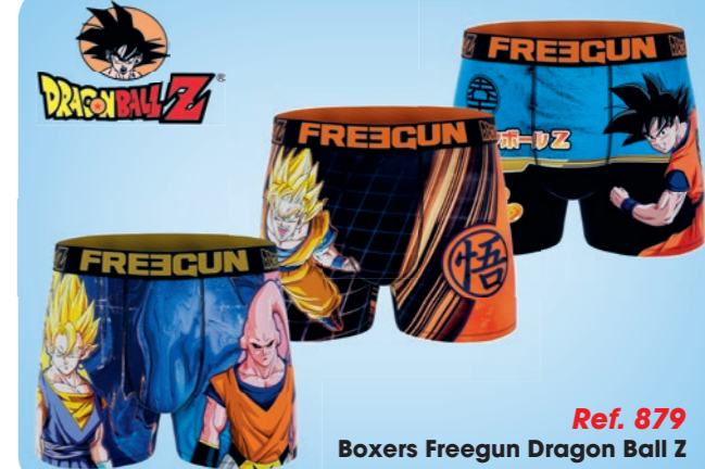
Ref. 879 Boxers Freegun Dragon Ball Z