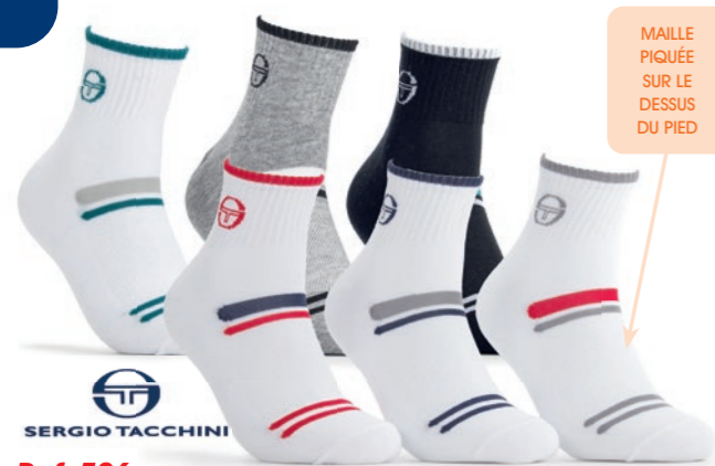
Ref. 586 Chaussettes tige 3/4 Sergio Tacchini Composition : 66% coton - 32% polyester - 2% élasthanne 2 tailles : T1 (39/42) - T2 (43/46)