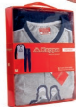
Ref. 867 Pyjama Kappa Composition T-shirt : 95% coton - 5% viscose Composition pantalon : 100% coton 5 tailles : T2 (S) - T3 (M) T4 (L) - T5 (XL) - T6 (XXL)