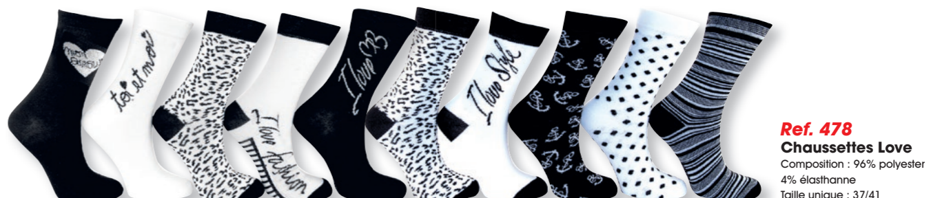
Ref. 478 Chaussettes Love Composition : 96% polyester - 4% élasthanne Taille unique : 37/41