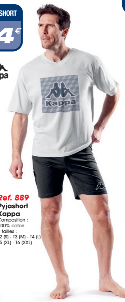
Ref. 889 Pyjashort Kappa Composition : 100% coton 5 tailles : T2 (S) - T3 (M) - T4 (L) T5 (XL) - T6 (XXL)