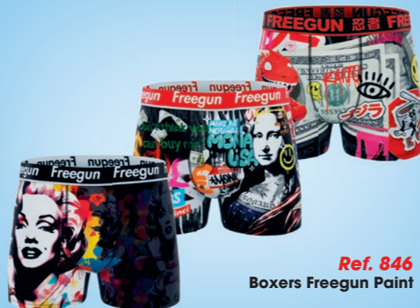
Ref. 846 Boxers Freegun Paint