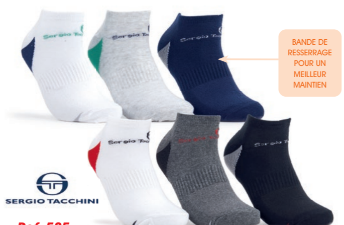
Ref. 585 Chaussettes tige Courte Sergio Tacchini Composition : 60% coton - 38% polyester - 2% élasthanne 2 tailles : T1 (39/42) - T2 (43/46)