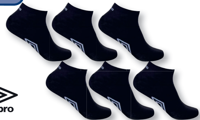
Ref. 543 Chaussettes tige courte Umbro Composition : 58% coton - 40% polyester - 2% élasthanne 2 tailles : T1 (39/42) - T2 (43/46)