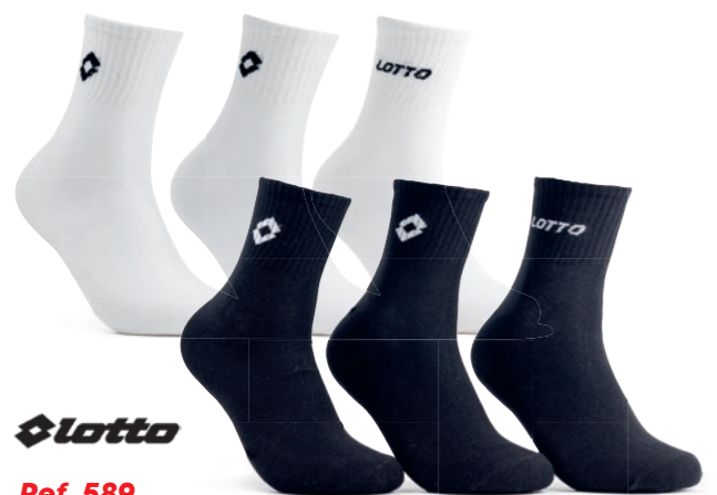
Ref. 589 Chaussettes tige 3/4 Lotto Composition : 72% coton - 26% polyester - 2% élasthanne 2 tailles : T1 (39/42) - T2 (43/46)