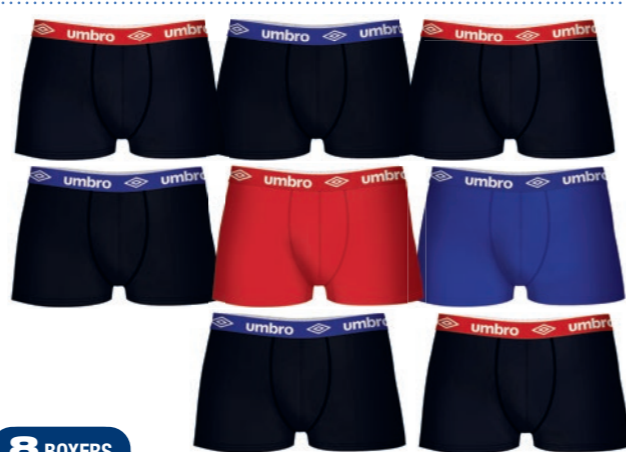
8 BOXERS 36€ Ref. 886 Boxers Umbro Composition : 100% coton 5 tailles : T2 (S) - T3 (M) - T4 (L) - T5 (XL) - T6 (XXL)