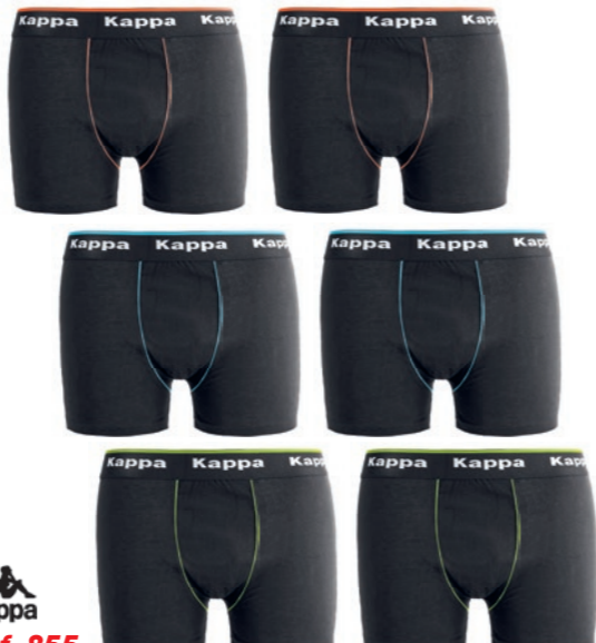
Ref. 855 Boxers Kappa