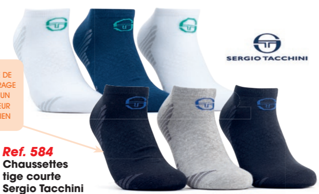
Ref. 584 Chaussettes tige courte Sergio Tacchini Composition : 64% coton - 32% polyester - 2% élastodienne - 2% élasthanne 2 tailles : T1 (39/42) - T2 (43/46)