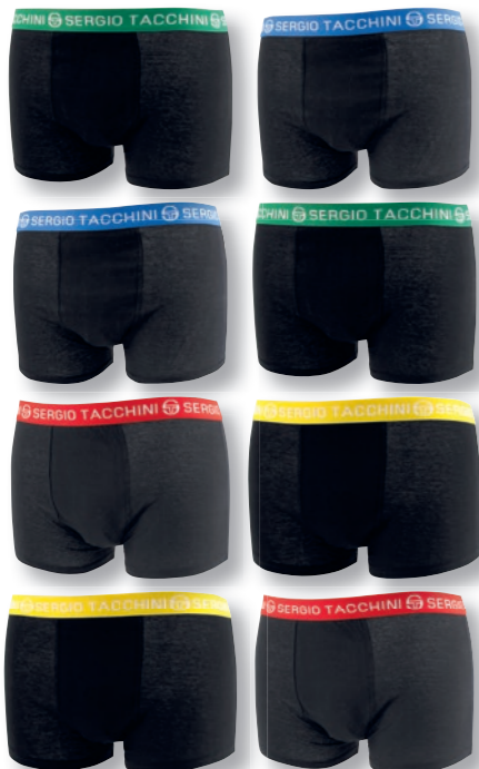
Ref. 835 Boxers Sergio Tacchini